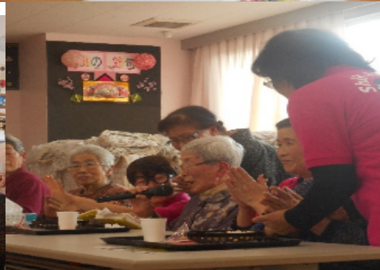
「中新田さくら組」の体操