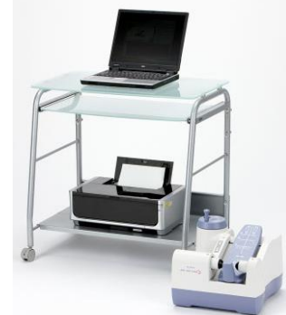
超音波骨密度測定器