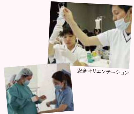
安全オリエンテーション