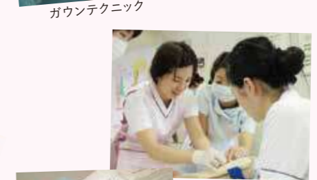
ガウンテクニック